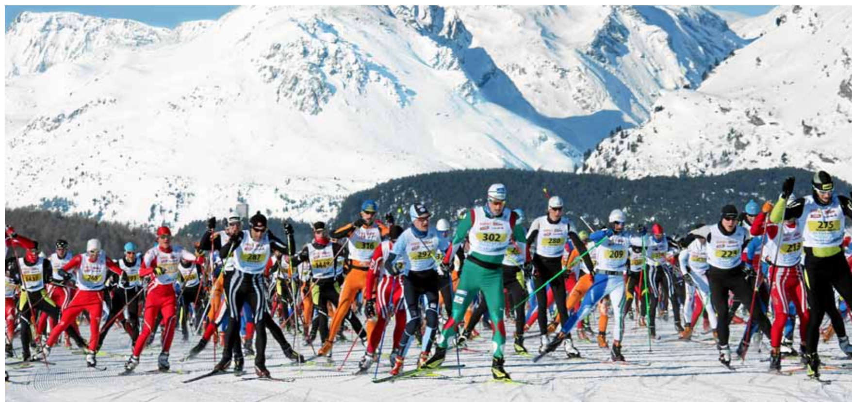
Am «Engadiner» absolvieren Amateur- und Elitelfahrer die 42 Kilometer von Maloja nach S-chanf.

In der Coop Verkaufsstelle Haag können von Dienstag bis Samstag, 8. bis 13. März, feine Fleischwaren probiert werden. Der Pro Montagna Berg Hinterschinken, Znüni-Würstli, Mostbröckli, Gourmet-Pantli und eine Rheinertaler Bauernwurst gehören zur Auswahl. Auf diese und weitere Fleischwaren gibt es während der Degustation 10 Prozent Rabatt.